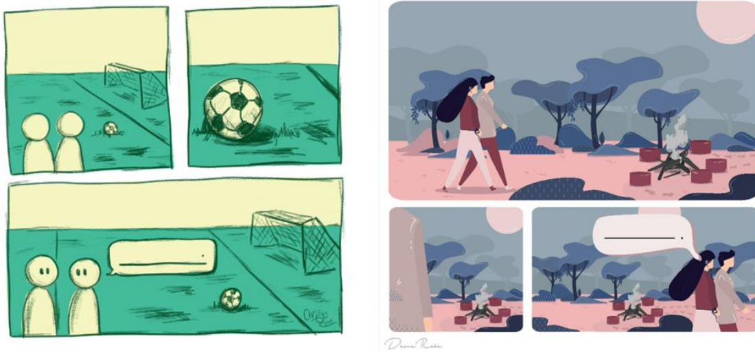
Figuur 4 – Twee visuele vrae wat EXI-INF-PL 5 -kontekste uitbeeld

Om te verhoed dat daar te veel onbruikbare antwoorde deur respondente aangebied word, en om te verseker dat die antwoorde tot 'n mate met mekaar vergelykbaar kan wees, is die illustrasies ook met kontekstuele leidrade toegelig. Daar is byvoorbeeld gevra dat die respondent 'n spesifieke werkwoord of bywoordelike bepaler moet gebruik in hul antwoorde. Die leidrade by elkeen van die INF-kontekste is soos volg geformuleer: